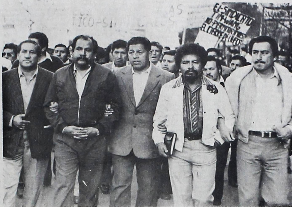
-MARCHA DEL HAMBRE. Unos veinte mil trabajadores asistieron ayer a la marcha de protesta por el alza del costo de vida. En la foto, altos dirigentes de la COB encabezando el mitin. La COB declaró roto el diálogo con el Gobierno.

La "COB", que debió iniciar su participación en el "diálogo" el viernes pasado, impuso condiciones de última hora que no aceptó el Gobierno, ha dejado ahora aún más abandonado el proyecto oficial, mientras sus afiliados le han enseñado los dientes al régimen.