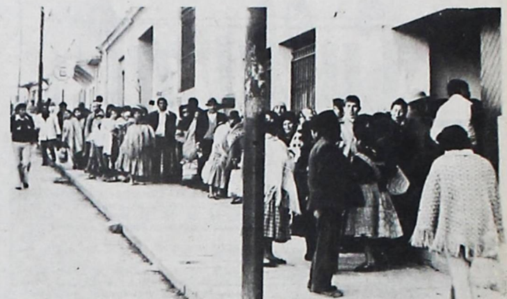
COLAS. -- El drama de las colas para la adquisición de productos y artículos básicos de consumo. A la molestia de las colas se debe añadir el malhumor de los comerciantes; la especulación en los precios, y lo más desesperante, la falta de dinero para adquirir lo indispensable.