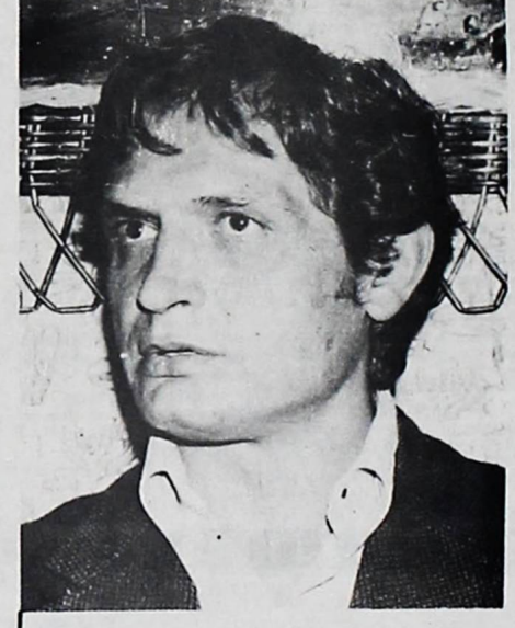
JAIME PAZ ZAMORA. -- Llega hoy al país y, según dirigentes del MIR, ofrecerá una conferencia de prensa en el Aeropuerto de La Paz.

Al acto que se cumplirá el jueves próximo en horas de la noche, han sido invitados dirigentes de varias organizaciones políticas y de la UDP, informaron dirigentes del MIR.