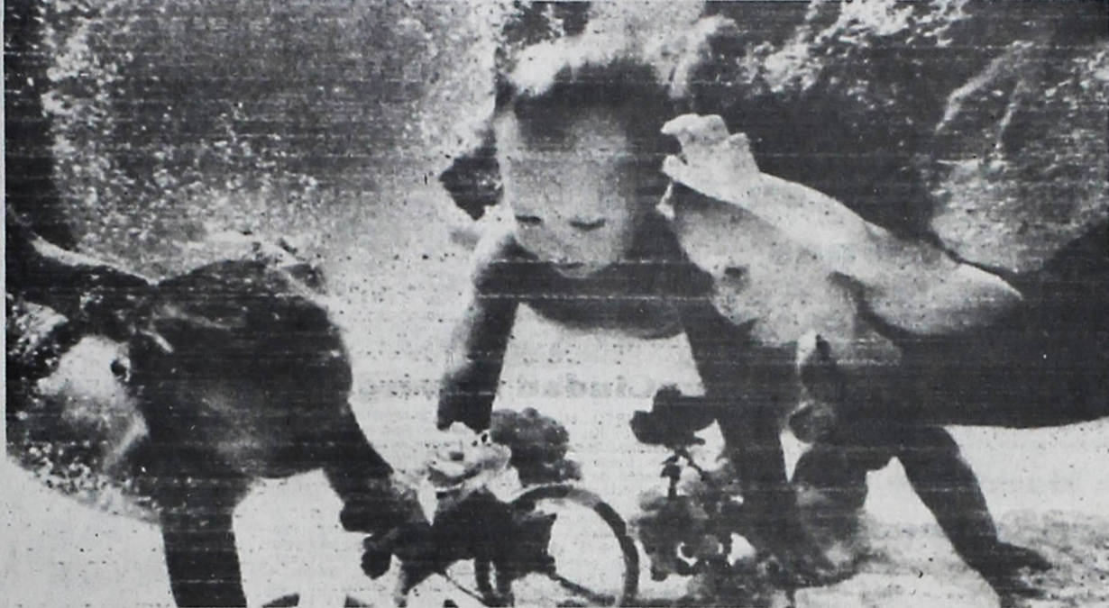
CAMPEONES.—Tres alumnos, de dos años, de un curso especial de natación para niños de edad preescolar recogen flores del fondo de una piscina. (AIKEN - CAROLINA DEL SUR, 19 de julio).

La ventajosa de Moscú parecía increíble. Se tuvo una idea de ella cuando el 12 de abril de 1961 el primer cosmonauta humano, Yuri Gagarin, era lanzado a bordo de la cápsula "VOSJOD I" y circulaba la Tierra durante poco más de una hora en una sola órbita.