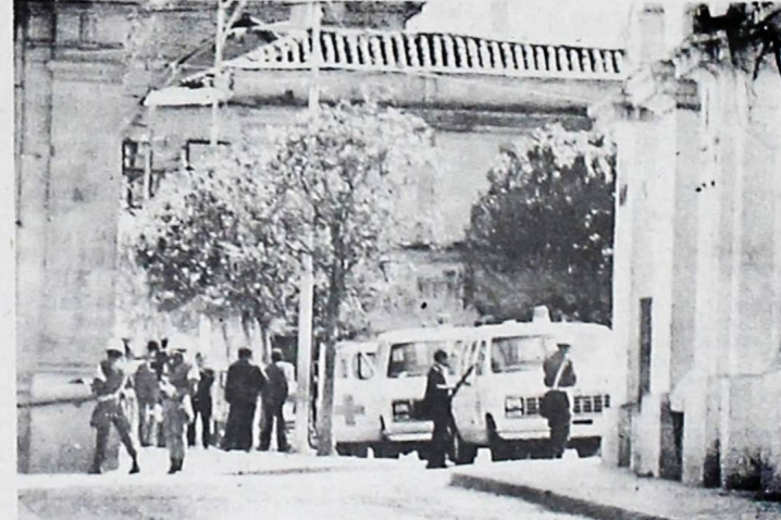
AMBULANCIAS. — El Palacio de Gobierno también fue teatro de la acción paramilitar el 17 de julio de 1980. La foto muestra a varios paramilitares armados bajando de las ambulancias para ingresar a la casa de gobierno aquel día.

Se espera, según "PAP" que la expedición a Las Bermudas pueda salir el año próximo.