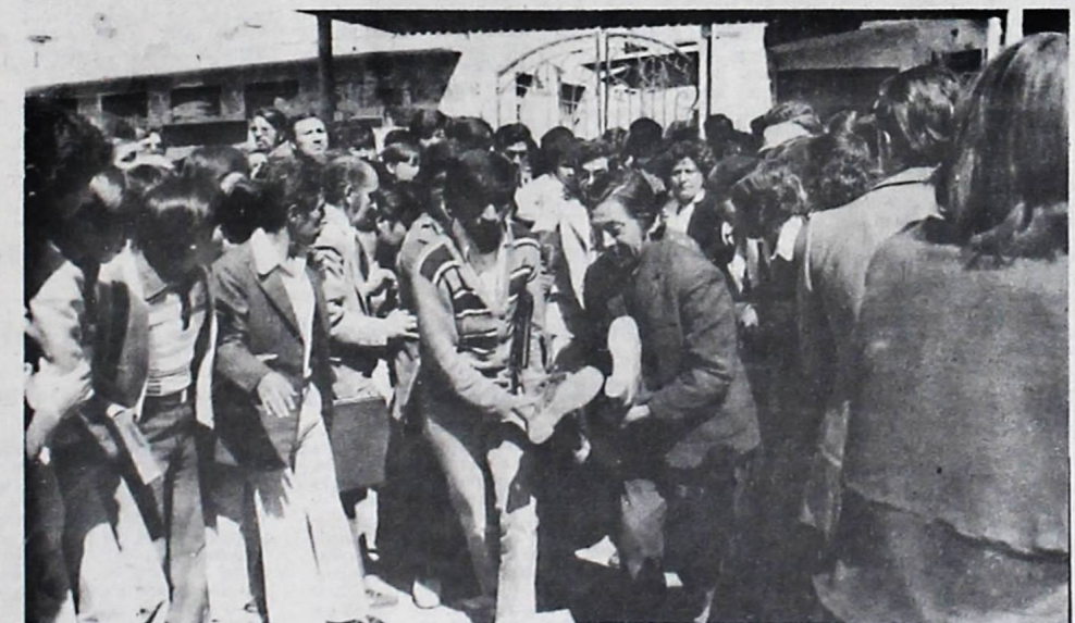
RESCATE DE UN CADAVER. — Después de su acción armada en la COB los paramilitares huyeron con el cadáver de Marcelo Quiroga y dejaron otro muerto, un dirigente minero cuyo cuerpo fue rescatado por la multitud, como se ve en la foto.