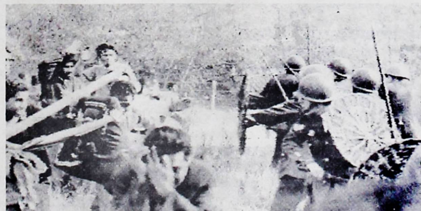
POLICIA CONTRA MANIFESTANTES. - La Haya, 26 (AP).- La policía de La Haya frente a la cárcel de Scheveningen lucha con manifestantes molucanos esta mañana.

BEIRUT, 26 (AP).- El rey Hussein de Jordania nombró hoy nuevo gobierno para aplacar a los dirigentes árabes que lo critican desde El Cairo acusándolo de "conspirar" para erradicar a las guerrillas palestinas. Además esos mismos dirigentes árabes dicen que el ejército jordano violó el alto al fuego y que de esto es responsable el monarca. Hussein nombró a Ahmed Toukan, jefe de la Corte Real y ex vicepresidente, como Primer Ministro. Toukan es Palestino. No obstante, el rey mantiene a militares en los cargos claves. Precisamente fue la ira de los guerrilleros por el nombramiento de un régimen militar lo que ayudó a desatar la Guerra Civil la semana pasada. El rey ha respondido, furiosamente, a una acusación que en El Cairo le hizo el Presidente de Sudán, Jaafar Numeiry, que dijo que tirotearon ayer en Amman a su delegación de pacificación y que de ello era culpable el rey. "Estamos convencidos", dijo Numeiry, "de que las autoridades jordanas conspiran para liquidar a la organización de liberación palestina". Antes de que hablara Numeiry, el Presidente de Egipto, Gamal Abdel Nasser, acusó a Jordania de haber violado la tregua y de estar tratando de eliminar a los guerrilleros.