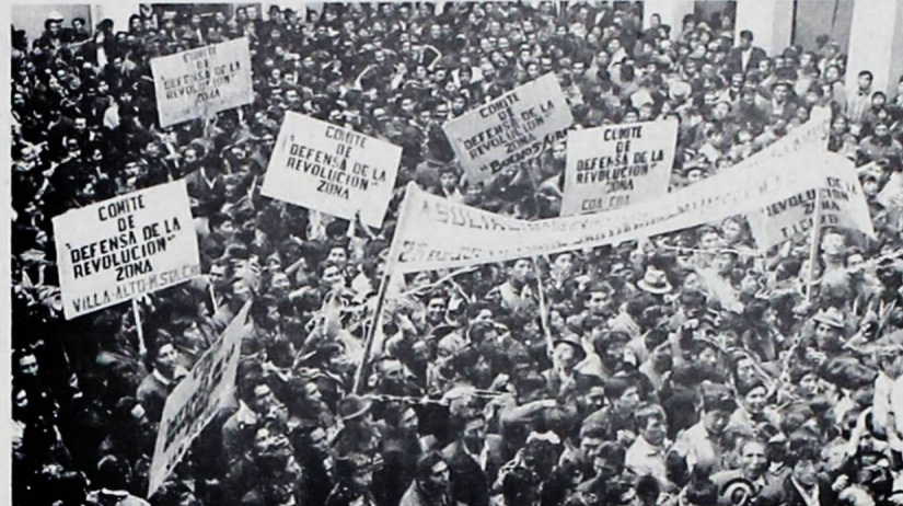
APOYO AL PRESIDENTE. - El hall del Palacio de Gobierno fue invadido la tarde de ayer por miembros de Comités de Defensa de la Revolución de varias zonas de la ciudad. Ante ellos el Presidente Ovando denunció que en su primer año de gobierno fue objeto de presiones de la derecha y la izquierda.