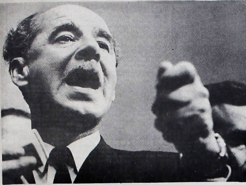
PERMANECERA EN EL GOBIERNO. - Los militares que rechazaron la renuncia del Gral. Ovando plantearon a éste la necesidad de una política nacionalista, la reestructuración del gabinete y el despido de las funciones públicas de varios elementos de tendencia marxista, condiciones que fueron aceptadas por el Presidente.