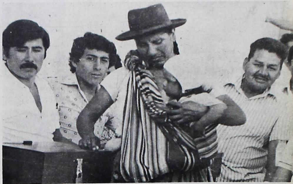
ELECCIONES.- En todas las regiones del país la ciudadanía estuvo a cumplir con su deber cívico, el pasado domingo. En la fotografía, una "chollita" cochabambina que radica en Santa Cruz aparece cuando votaba en la ciudad oriental.