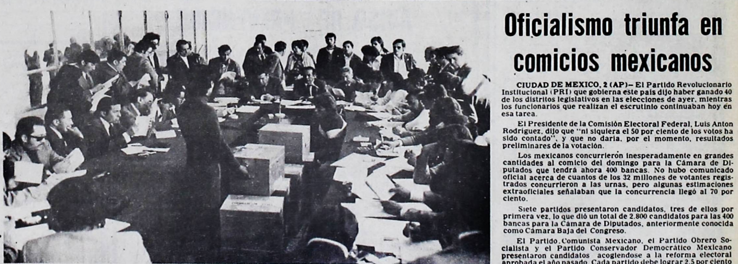
COMPUTO DE VOTOS.- En la primera jornada de cómputo de votos, la Corte Departamental Electoral hizo el recuento de 46 años, hasta las 19 horas. A partir de las 20 y hasta las 24 horas, fueron computadas algo más de una decena de años. El comportamiento de los delegados de partidos fue correcto y el trato, entre ellos, cordial y respetuoso. Hasta el 16 de este mes, la Corte Departamental deberá computar más de 2.500 años, tanto de la ciudad como de provincias. Al frente, los miembros de la Corte, y a los costados, los delegados de partido.

El Partido Comunista Mexicano, el Partido Obrero Socialista y el Partido Conservador Democrático Mexicano presentaron candidatos acogidos a la reforma electoral aprobada el año pasado. Cada partido debe lograr 2,5 por ciento de los votos para poder permanecer registrado para las próximas elecciones.