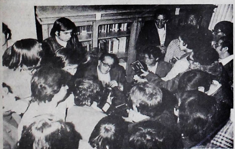
HUELGA DE HAMBRE.- El ex-presidente Hernán Siles Zuazo y candidato de la Unidad Democrática y Popular (UDP), Hernán Siles Zuazo, se declaró ayer en huelga de hambre indefinida "en defensa de la democracia." En la fotografía se registra el momento en que Siles anunciaba su extrema determinación en la Biblioteca del Senado.