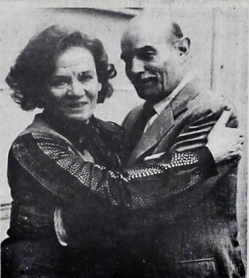
PRESIDENTES.- El Presidente del Senado y la Presidente de Diputados, Walter Guevara (derecha) y Lidia Gueller (izquierda), aparecen congratulándose después de fuera elegida la directiva de la Cámara de Diputados. Hasta las 3 de esta madrugada, el Congreso no había podido dar la mayoría requerida para la elección presidencial.