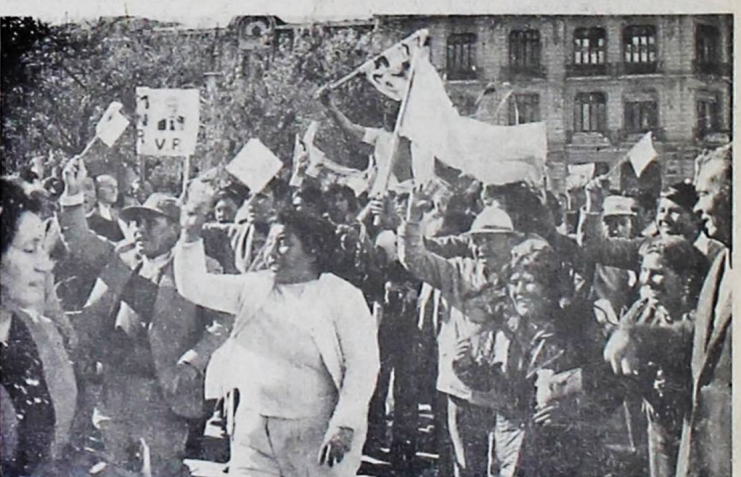
PARTIDARIOS.- El pueblo se mantenía ayer a la expectativa de los acontecimientos del Congreso. Parciales de Víctor Paz y Hernán Siles, entre tanto, congresados frente al Legislativo, se mantuvieron incansables hasta este amanecer, dando vitores a sus líderes. A las 3 de la madrugada, sólo permanecían en la plaza los adictos a la fórmula del MNR.