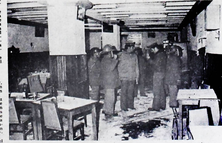
ATENTADO. - Un atentado terrorista, perpetrado a las 23.30 horas de anoche en el restaurante "Lido Grill", ubicado en la convergencia de la avenida Mariscal Santa Cruz y el ingreso a la calle Comercio, en La Paz, ocasionó la muerte de dos personas y daños materiales de consideración. Un informe preliminar de la Brigada de Explosivos señaló que se utilizó en el atentado un explosivo plástico.