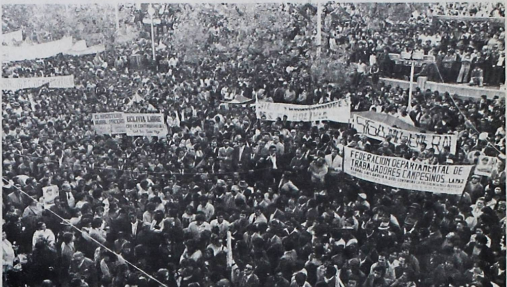
CONCENTRACION.- Una concentración de organizaciones sindicales y de diversas actividades locales, se realizó ayer en la plaza Murillo para expresar su apoyo al Gral. Luis García Meza. Los oradores coincidieron en su pedido para que el actual Presidente continúe en sus funciones.

Sin embargo, esos mismos diplomáticos advierten que Washington no puede enfocar el programa solamente como el mejor camino para contener el riesgo de la expansión del comunismo o la acción e influencia de Cuba en la región.