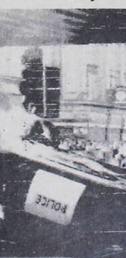
VIOLENCIA EN BRITXTON.- Londres 10 (AP).- Un carro de la Policía arde en Brixton al sur de Londres, en la noche de este viernes en la más reciente demostración de violencia en Gran Bretaña. El barrio de Brixton fue escenario, en abril último, de las más violentas manifestaciones raciales en el país

Por otra parte, el Canciller Rolón Anaya les expresó que le había extrañado una declaración atribuida a un funcionario de la Comunidad Económica Europea (CEE) formulada en Bogotá según un despacho de la Agencia Latin Reuter registrado en la prensa local el día de ayer. Al respecto, les pidió que confirmaran la veracidad y alcances de expresiones relativas a la situación interna de Bolivia, en sentido de que se habría sostenido que los países de la CEE no firmarían el Convenio de Cooperación e Intercambio Económico con los Países del Pacto Andino, mientras no se