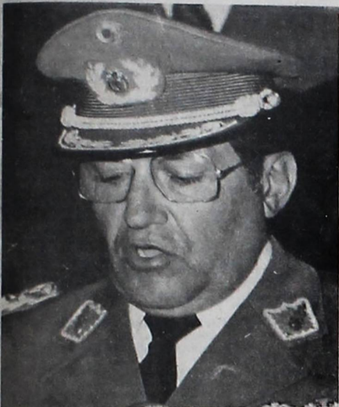
RENUNCIA.- El Gral. Luis García Meza renunció anoche a la Presidencia de la República, después de 384 días en el poder. En su mensaje a la Nación, señaló que permanecerá alerta para defender el proceso iniciado el 17 de julio del pasado año. Su renuncia fue hecha en un acto efectuado en el Palacio de Gobierno y transmitida por radio y televisión.

Gral. Natusch Busch anunció para hoy documento fijando posición