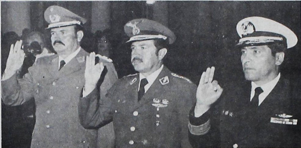
MANDO DE LA NACION.- La Junta de Comandantes asumió anoche el mando de la Nación, como consecuencia de la renuncia del Gral. Luis García Meza. El Comandante de la FAB y miembro más antiguo de la Junta, Gral. Waldo Bernal, dijo que el gobierno pretende organizar una sociedad justa, digna y democrática y que seguirá los lineamientos señalados el 17 de julio de 1980.

Bernal, dijo que el gobierno pretende organizar una sociedad justa, digna y democrática y que seguirá los lineamientos señalados el 17 de julio de 1980.