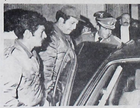
DESPEDIDA.- El General Luis García Meza se retiró del palacio de gobierno inmediatamente después que entregó el mando de la Nación a la Junta de Comandantes. En la fotografía se registra el momento en que abordaba su automóvil para dirigirse, posteriormente, a El Alto de La Paz, donde se reunió con el Comandante del Ejército argentino, General Leopoldo Galtieri, quien estuvo de paso por El Alto.

Inmediatamente después de la posesión de la Junta de Comandantes, que a partir de anoche se hizo cargo del gobierno de la Nación, el Canciller de la República, Dr. Mario Tólon Anaya, a nombre de sus colegas de Gabinete, hizo la siguiente declaración: "Con la renuncia del Gral. García Meza y la entrega del poder a la Junta de Comandantes, la situación continúa igual y no se puede seguir enlodando al país", enfatizó. Los máximos jefes militares de Potosí, que apoyan la rebelión de Santa Cruz, subrayaron que el cambio tiene ser total y que si el poder sigue en los miembros de la Junta de Comandantes es continuar dentro del mismo esquema. Con la renuncia del Gral. García Meza y la entrega del poder a la Junta de Comandantes, la situación continúa igual y no se puede seguir enlodando al país", enfatizó.