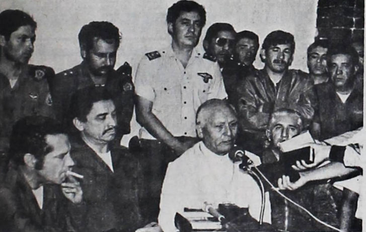
EN SANTA CRUZ.- El Comando Revolucionario, encabezado por los generales Alberto Natusch Busch y Lucio Añez Rivero, anunció, a tiempo de aceptar la mediación de la Iglesia en el conflicto que evitaría enfrentamientos entre los bandos en pugna. El anuncio fue hecho en una conferencia de prensa.