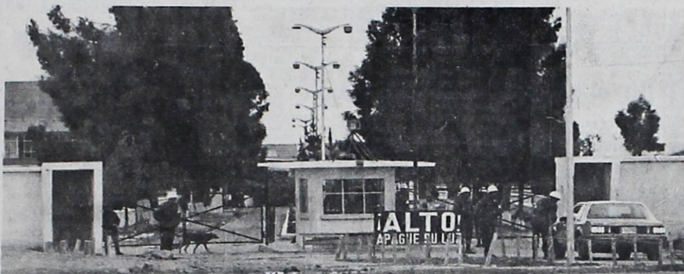
ESCENARIO DE LA REUNION.- Estrictas medidas de seguridad militar fueron adoptadas ayer en dependencias del Grupo Aéreo de Caza (GAC), lugar en el que se realizaron las negociaciones entre la Junta de Comandantes y el Comando Revolucionario de Santa Cruz. No se permitió el ingreso de periodistas, ni de civiles.

Comandantes acepta convocar a una reunión de Grandes y Pequeñas Unidades e Institutos de las Fuerzas Armadas.