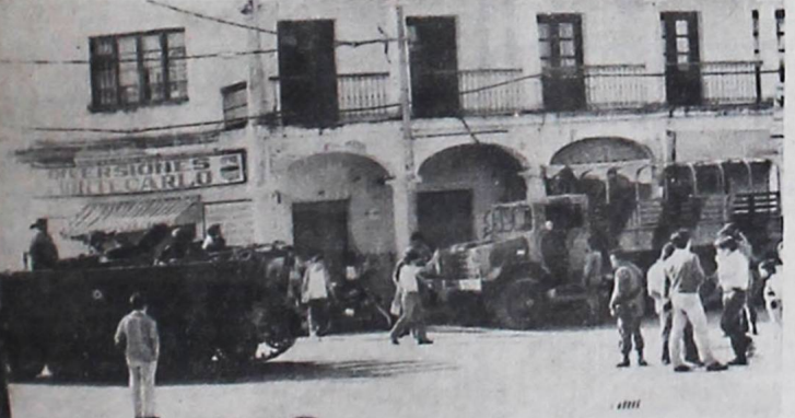
OCCUPACION.- Durante el alzamiento militar, iniciado el lunes, tropas militares, adictas a los generales Natusch y Añez, ocuparon las principales arterias de la ciudad de Santa Cruz. En la fotografía, un carro de asalto y un "calmón" en la Plaza "24 de Septiembre" de Santa Cruz.