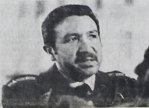
SOLUCION.- El general Waldo Bernal Pereira, Comandante de la Fuerza Aérea y miembro más antiguo de la Junta de Comandantes anunció, anoche, al salir del Palacio de Gobierno, que se estaba "en vísperas de la solución favorable" de la crisis militar. Posteriormente, el acuerdo fue anunciado por Natusch, en Santa Cruz.

El cabecilla del movimiento convocó a una conferencia de prensa, en la que dijo que "el Comando Revolucionario rechazaba cualquier posibilidad de