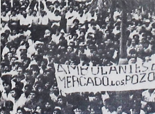
CONCENTRACION.- La composición gráfica, muestra aspectos de la segunda concentración popular, efectuada el miércoles en la Plaza de Santa Cruz, en apoyo al alzamiento militar, encabezado por los generales Alberto Natusch Busch y Lucio Añez Rivero. En esa oportunidad, el Comando Revolucionario propuso la realización de una reunión de grandes y pequeñas unidades militares, para elegir al nuevo Presidente de la República. La crisis militar encontró ayer un principio de solución en negociaciones directas, efectuadas en La Paz, entre la Junta de Comandantes y el general Natusch, con la mediación de la Iglesia Católica.