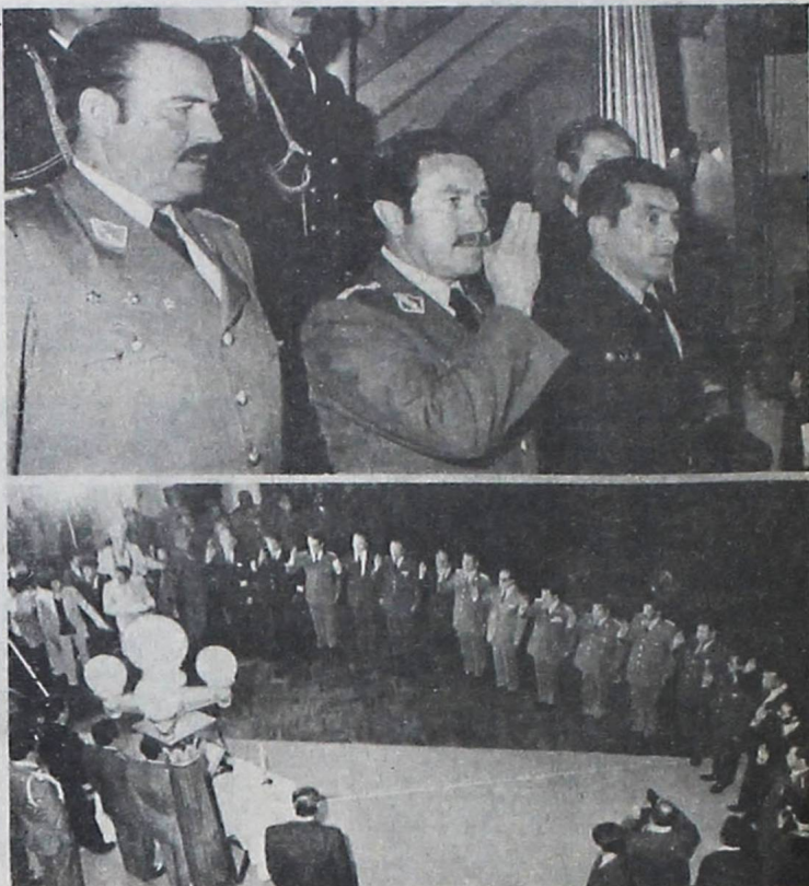
GABINETE. El nuevo equipo ministerial prestó el juramento de ley en un acto que se cumplió anoche en el Palacio de Gobierno. Siete ministros del gobierno de García Meza, fueron ratificados; uno, Rolando Canido, pasó de Ministro de Trabajo a Interior, Migración y Justicia; el ex-Prefecto de La Paz, Guido Suárez, ocupa ahora el cargo de Ministro de Trabajo. Siete ministros son civiles y diez militares. Falta designar al Ministro de Energía e Hidrocarburos.