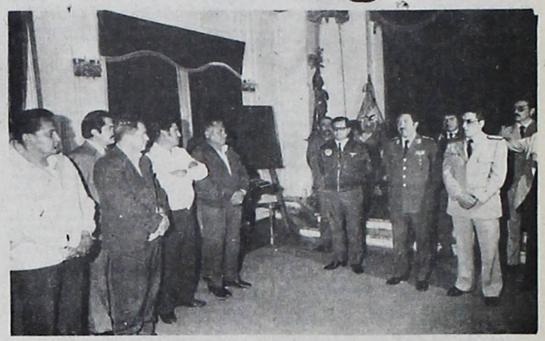
ADVERTENCIA.- El Gral. Waldo Bernal advirtió que la Junta de Comandantes actuará drásticamente contra cualquier actitud o declaración que se haga a nombre de algún comando revolucionario. En la fotografía, Bernal junto a otro miembro de la mencionada Junta, el contraalmirante Oscar Pammo, durante el acto cumplido ayer en el Palacio de Gobierno, en el que dirigentes campesinos expresaron su apoyo al gobierno.