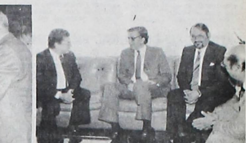
Gobierno concedió a Ministro peruano de Comercio