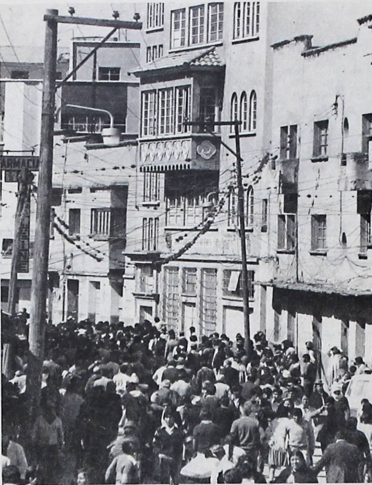
Acción de agentes gubernamentales