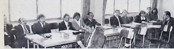
Clausura de seminario sobre actividades aduaneras