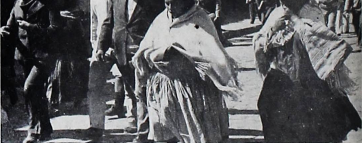
Gasificación en sede de choferes

Los gases lacrimógenos lanzados por los agentes que allanaron ayer la sede de los transportistas de La Paz causaron confusión entre las personas que transitaban por las cercanías de ese local ubicado en la calle Zulo Flores.