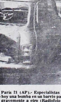
ATENCIÓN EN PARÍS.- París 21 (AP).- Especialistas de la Policía Inspeccionan el automóvil junto al cual estalló hoy una bomba en un barrio parisino. La explosión mató a un experto en explosivos e hirió gravemente a otro.

Con el acoplamiento del "Soyuz T-7" al laboratorio espacial comenzó ayer un programa científico de una semana de duración, según informó hoy la agencia soviética "TASS".