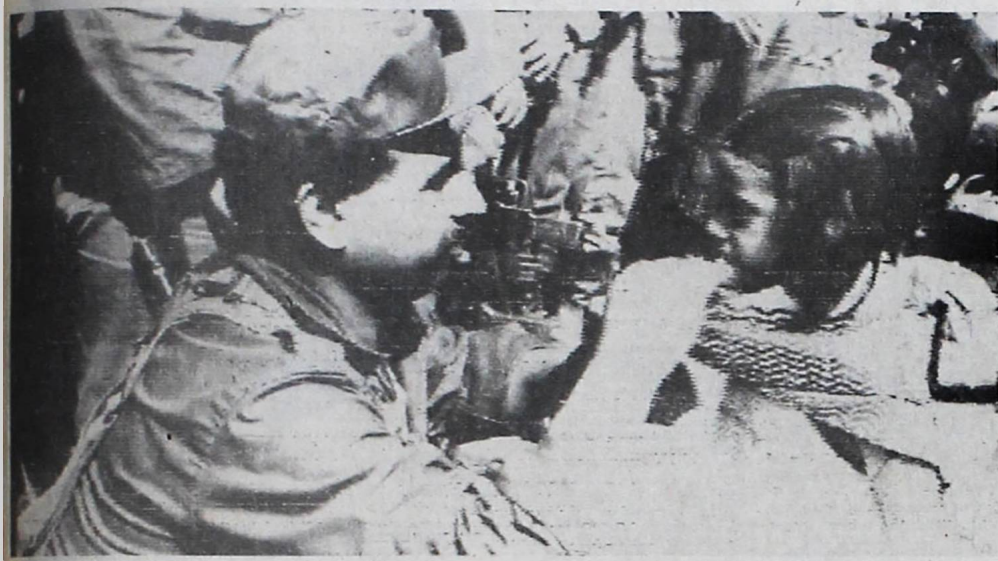
DESPELIDA.- Beirut 21 (AP).- Un combatiente palestino se despidió de su pequeña hija hoy, en la capital libanesa, antes de ser retirado junto con otros elementos de la Organización de Liberación Palestina. Los primeros guerrilleros palestinos partieron por barco en la operación de retirada que durará dos semanas (Radiofoto AP).

"Situación obliga al país a que reduzca gastos y aumente ingresos. Debe evitarse déficit de 40 mil millones de pesos"