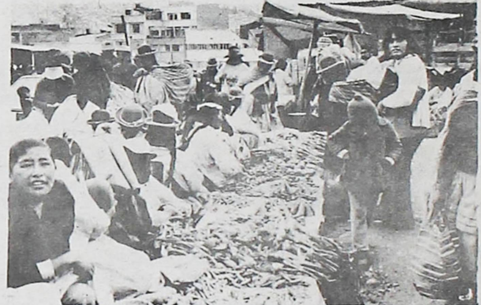
4 .TAMBIEN HUBO ADECUADO ABASTECIMIENTO DE VERDURAS.- La nota gráfica corresponde al Mercado Uruguay de la Avenida Buenos Aires donde las verduras se vendieron normalmente.