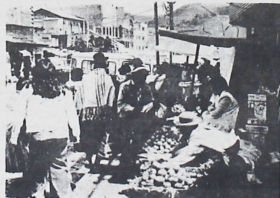
5 .ZONA DE CHIJINI DONDE SE VENDEN TODA CLASE DE PRODUCTOS. — Desde aceite, pasando por azúcar hasta harina, hay de todo en las tiendas de la zona de Chijini, la foto es un documento.