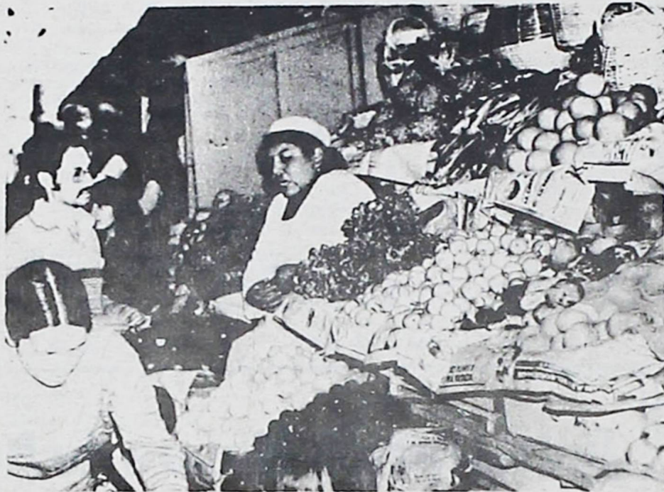
1 .MERCADO CAMACHO CON ABUNDANCIA DE FRUTA. — esta foto fué tomada ayer sábado en el Mercado Camacho y se advierte la abundancia de fruta a precios racionales como pueden ver.

Los agoreros del tremendismo iban pregonando que la gasolina costaría $b. 15.00 y resulta que subió un solo peso. Y así por el estilo los campeones del rumor maligno estaban presentando un cuadro angustioso que encontró respuesta con medidas bien pensadas y sumamente mesuradas.