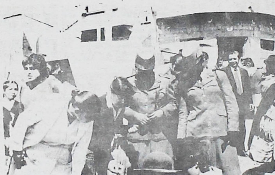
3 .LA BRIGADA FEMENINA HIZO BUEN CONTROL EN EL MERCADO RODRIGUEZ. — Las señoritas policías asignadas a la Intendencia Municipal efectuaron un minucioso control de precios en todos los mercados.