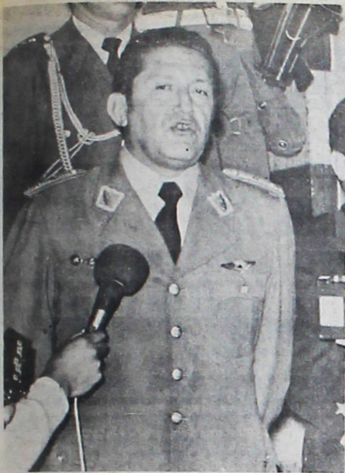
Después de reunirse con su gabinete para evaluar la situación tras aplicarse los correctivos económicos, el Presidente García Meza recibió hoy el apoyo de los choferes.